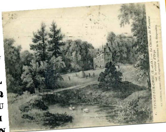
Le Château de Prunet par F. HOTTOT, avant 1900, représentant la situation de la Gilquinière.

D E L A G I L Q U I N I E R E A P E R R A Y - V A U C L U S E