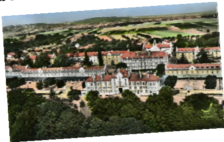
Les amis de l'histoire de Sainte-Geneviève des bois et ses environs

EN VENTE A PARTIR DU MERCREDI 23 DECEMBRE 2009