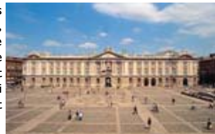
Place du Capitole

Ville principale du Sud-ouest de la France, chef lieu du département 31 de la Haute-Garonne et de la région Midi-Pyrénées. Toulouse est une ville d'envergure et compte une forte densité démographique, la plus évolutive de France, avec son melting-pot à l'instar des autres villes françaises. L'architecture de Toulouse est marquée par la brique dont la couleur chaude rouge-orangée lui confère le surnom de « ville rose ». Aujourd'hui, la brique est mise en valeur comme un symbole de la ville. Cependant, dans les constructions modernes, elle n'est utilisée que comme parement décoratif. Toulouse est par ailleurs une technopole européenne regroupant de nombreuses industries de pointe en matière d'aéronautique, d'informatique, et de spatial, ainsi que de nombreux instituts de recherche. Elle est dotée d'équipements culturels prestigieux comme le centre des congrès, la médiathèque José-Cabanis, le Zénith, le musée d'art moderne et contemporain des Abattoirs, la cité de l'Espace ou encore le Théâtre national de Toulouse. Le capitole, construit en 1911, qui est considéré comme l'emblème de la ville, et par ailleurs l'emplacement du pouvoir municipal depuis plus de huit siècles. Toulouse est également une ville estudiantine, la quatrième de France. Elle est aussi connue pour sa gastronomie et plus particulièrement son cassoulet. Des sommités y sont nées, telles que Claude Nougaro.