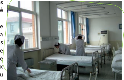
Exemple de chambre de soins

La pédo psychiatrie semble en être à ses balbutiements dans ce pays. »