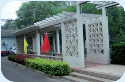
HOPITAL HUI LONG GUAN

Il est un point sur lequel les membres de la délégation du Groupe Public de Santé Perray-Vaucluse s'accordent ; l'accueil qu'ils ont reçu à leur arrivée :