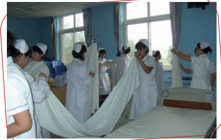
Etudiantes infirmières s'exerçant à la réfection des lits

« L'organisation de notre séjour alternant visites touristiques et visites de structures hospitalières était très bien fait. Nous avons visité le Beijing Huilongguan Hospital puis un centre de réadaptation et un hôpital situé en milieu rural.