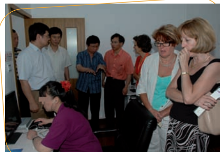
Utilisation du logiciel de remédiation cognitive dans un hôpital de jour

« La délégation française était pluri professionnelle et sa composition avait été faite en fonction des thématiques qui avaient été choisies par les Chinois. Je voudrais également souligner le comportement exemplaire de la délégation française qui a su bien représenter l'établissement avec une réelle motivation professionnelle accompagnée d'une curiosité scientifique et clinique. Elle est arrivée en Chine avec modestie et avec le souci d'échanger plus que de montrer son savoir-faire. Ce qui incarne cela, c'est la forte implication dont elle a fait preuve et la complémentarité qui la caractérisait. J'ai été marqué par l'évolution rapide de la psychiatrie chinoise qui, tout en restant enracinée dans la tradition chinoise, s'ouvre de plus en plus au monde occidental. Malgré cette