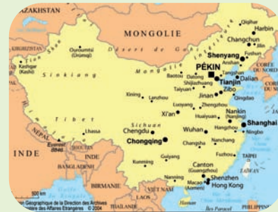
Visite de plusieurs hôpitaux à Pékin et ses alentours

A leur retour le 26 juin dernier, les membres de la délégation du Groupe Public de Santé Perray-Vaucluse nous ont livré leurs premières impressions.