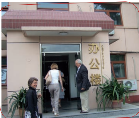
La délégation visite l'hôpital de Huilongguan à Pékin

« La délégation de Perray-Vaucluse a été très bien accueillie par la direction et les personnels de l'hôpital Huilongguan de Pékin.