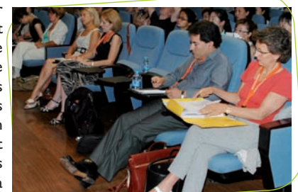
Conférence autour de l'échange des expériences et des pratiques